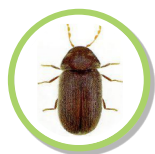
Lasioderma serricorne VRILLETTE DU TABAC