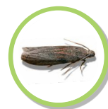
Ephestia cautella TEIGNE DES ENTREPÔTS