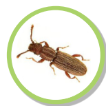
Oryzaephilus surinamensis LE SYLVAIN