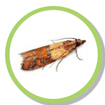
Plodia interpunctella PYRALE DE LA FARINE