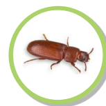
Tribolium castaneum TRIBOLIUM ROUGE DE LA FARINE